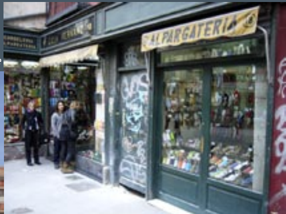
Handgemaakte espadrilles op Toledo

de toegangsdeur. Wat een wonderlijke ervaring is. Op het dak zijn vervolgens toevoegingen gedaan waarbij de voormalige gevel echter in stand is gehouden. Oud ontmoet nieuw op een zeer verrassende wijze. Het pand heeft geen tuin, maar aan het ernaast gelegen gebouw is tegen de gevel een 'tuin' ontworpen door de botanist Patrick Blanc. Fotogeniek. Het Caixa Forum ligt tussen het Reina Sofia en het Prado. Absoluut niet overslaan dus tijdens je museumdag.