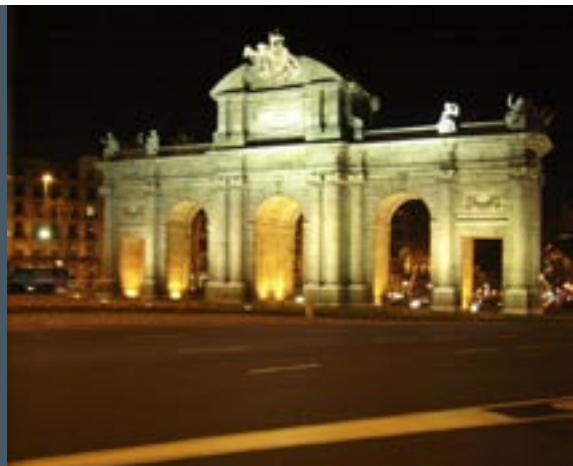
Porta de Alcalá