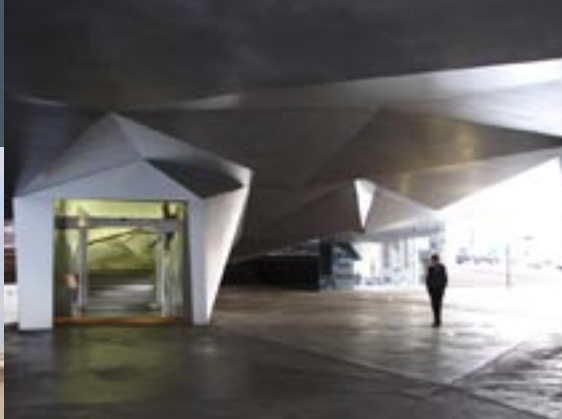
Ingang Caixa Forum