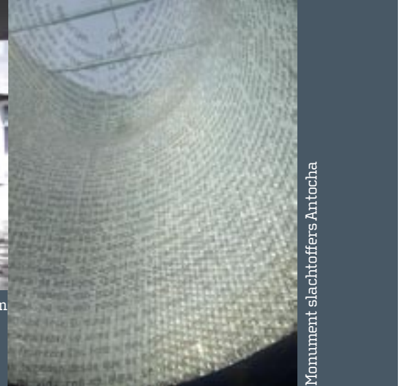
Monument slachtoffers Antiocha

bombardement op het Baskische Guernica. Toen was Spanje nog onder de heerschappij van de fascist Generaal Franco. Guernica was een republikeins bolwerk en Franco wilde hiermee korte metten maken. Wat hem aardig is gelukt, want de hele stad werd vernield. Vanzelfsprekend staan voor de Guernica van Picasso drommen toeristen. Is het te druk om het schilderij goed te zien, kun je het beste eerst andere werken van Picasso op deze verdieping gaan bekijken. Van sculpturen tot tekeningen en schilderijen; wist je weinig van deze kunstenaar, ben je meteen een heel eind verder als je deze etage van het Reina Sofia bezoekt. Het museum is enorm van formaat, zaal na zaal na zaal tref je grote namen aan. De Spaanse kunstenaar Tapiès is hier uiteraard sterk vertegenwoordigd. Wil je niet de hele dag in dit museum zijn, beslis dan van te voren in welke periodes en namen je bent geïnteresseerd.