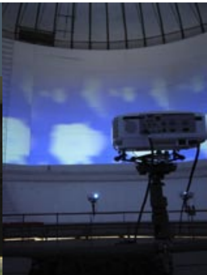
Installatie Eder Santos