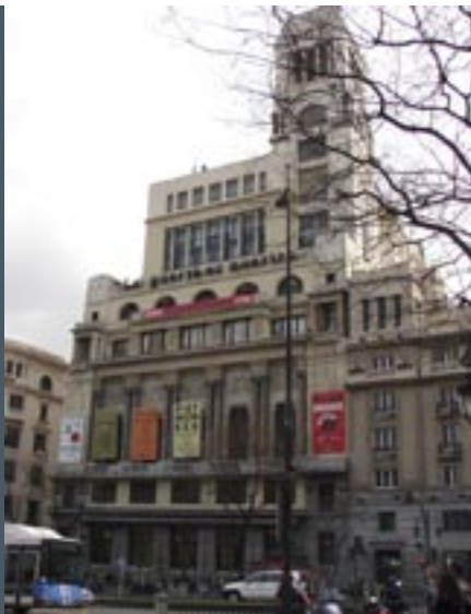
Circolo de Bellas Artes de Madrid