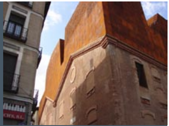
Caixa Forum, gebouwd door Herzog & De Meuron (detail)